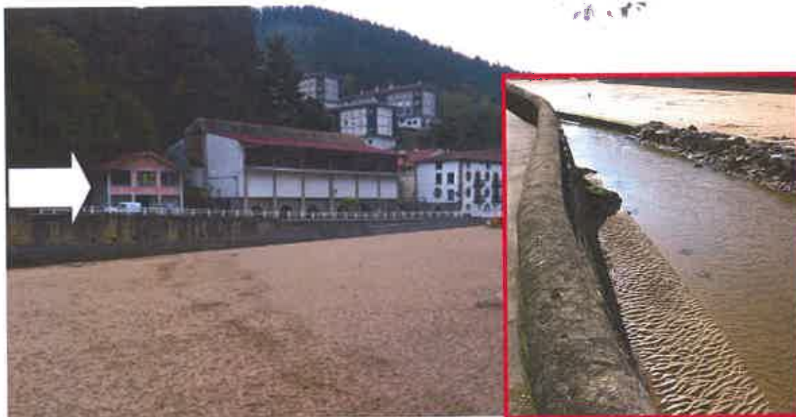
Fig. 1. Localización de EDAR de Ea (indicada con una flecha blanca). A la derecha detalle del cauce del riachuelo Argin, situado enfrente de la depuradora, donde las aguas tratadas son vertidas fuera del periodo de baños.