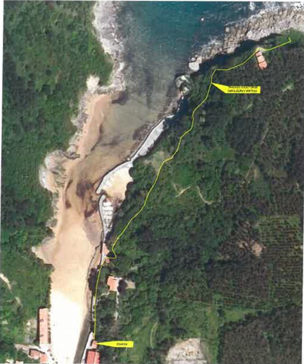
Fig. 2. Posición de la tubería del vertido de la EDAR de Ea (indicada con un trazo de color amarillo), para su vertido en costa abierta (La Atalaya).

Posteriormente desciende al aire libre hacia el mar por un talud acantilado, hasta que el vertido queda liberado ya en la proximidad del litoral rocoso (Fig. 3). Estas aguas caracterizadas por la presencia de niveles reducidos de nutrientes disueltos (nitrógeno, fósforo y carbono orgánico) y de menor densidad que el agua marina se mezclarán, difundirán y se degradarán en una zona de mezcla caracterizada por un alto hidrodinamismo debido al oleaje predominante en la zona. Las comunidades biológicas, tanto microbianas, como planctónicas (fitoplancton, zooplancton), bentónicas (sustrato duro y blando) y nectónicas (principalmente peces) pueden contribuir a la propia depuración de las aguas mediante el reciclaje de los nutrientes, cuando los niveles de estos en el agua son leves o