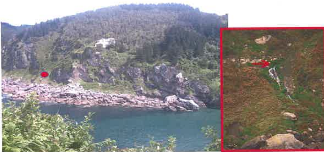
Fig. 3. Localización del punto de vertido (círculo rojo, izq.; flecha roja, dcha.) en el tramo de costa de La Atalaya.

Fuera de la temporada de baños, el vertido se realiza enfrente de la depuradora, sobre el cauce del riachuelo Argin, cuyas aguas mueren en la parte oriental de la playa (Fig. 1).