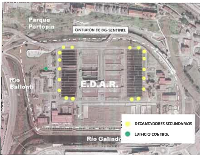
Figura 2: Fotografía aérea con la ubicación de las trampas BG-Sentinel en el interior de la E.D.A.R. Se indica para cada trampa su código de identificación.

Adicionalmente, se encuentra instalada una trampa Bg - Sentinel a la entrada del edificio control desde principios de agosto del 2020. El cometido de dicha trampa es capturas los posibles voladores que pasen por esta zona reduciendo las molestias que puedan ocasionar a los trabajadores de zona.