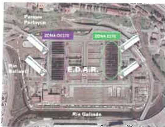
Figura 1: Fotografía aérea en la que se muestra la ubicación de los diferentes lugares de toma con red de muestras de agua en las instalaciones de la E.D.A.R.

Se identificarán y cuantificarán los inmaduros de culícidos (a nivel de especie) y quironómidos (a nivel de familia) presentes en el agua de los Clarificadores de Decantación Secundaria 2, 8, 11 y 17 (Figura 1).