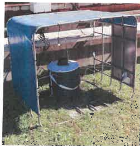
Figura 6: Vista general de una trampa BG-Sentinel y detalle del sistema de luz blanca.

Los dípteros adultos presentes en los botes colectores serán recogidos y almacenados en etanol al 70% e identificados en el laboratorio.