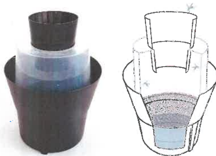
Figura 3: Trampa de oviposición BG-GAT (Biogent)

continuará con estrategia de gestión del mosquito tigre basada en: la vigilancia, formación y control. Para la detección y control de la expansión dentro de la E.D.A.R., se revisarán de manera exhaustiva las capturas de las trampas BG-Sentinel en busca de adultos. Por otro lado, se colocarán trampas de oviposición (Figura 3) en las posibles mejores zonas para la puesta de dicha especie.