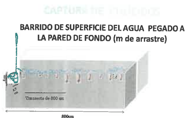
Figura 4: Esquema del transecto de 3 m de longitud en la superficie del agua, con red (8 cm alto por 9,7 cm ancho) de arrastre, para la toma de muestras de culícidos.

Se tomarán muestras de la superficie del agua de los Clarificadores de Decantación secundaria (Figura 4) haciendo un barrido de unos 3 m de recorrido con red de pesca (8 cm altura x 9,7 cm anchura) (ver imagen). Las muestras, en caso que fuera necesario, se meterán en botes de cría que se mantendrán bajo condiciones de laboratorio y diariamente se realizará una cuantificación de los adultos que van emergiendo.