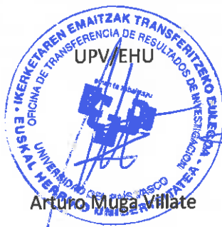
Arturo Muga Villate

Por todo ello, las partes convienen y suscriben el presente documento por triplicado en el lugar y fecha en el inicio indicados, aceptando la totalidad de sus cláusulas.