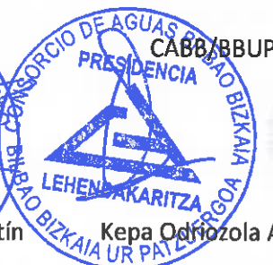
Kepa Odrozola Azula