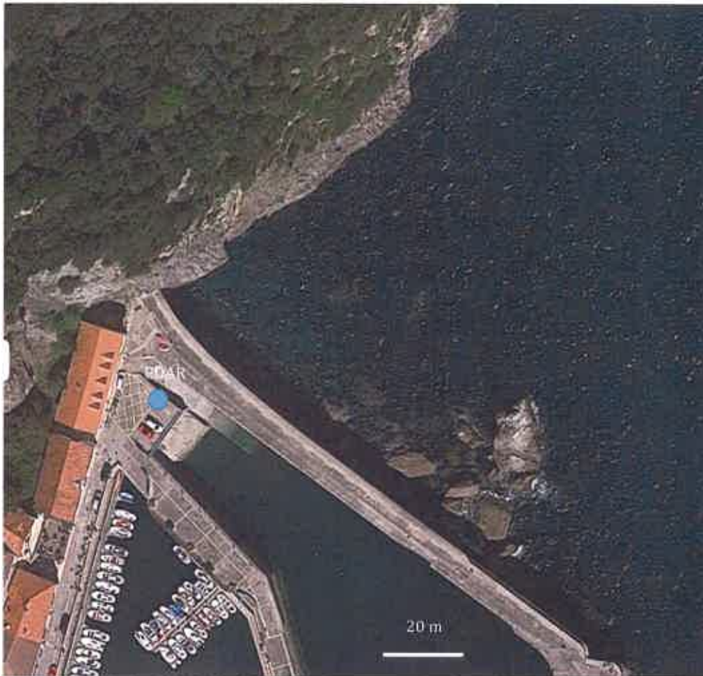
Fig. 1. Localización de EDAR de Ea (indicada con un círculo azul).