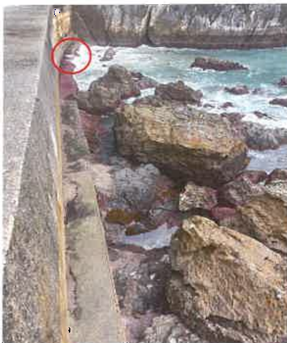
Fig. 2. Posición de la tubería del vertido de la EDAR de Elantxobe (indicada con un círculo rojo), para su vertido en costa abierta.

En el caso de la EDAR de Elantxobe, el punto de vertido queda localizado en la zona externa del rompeolas, más próxima al acantilado, en la parte baja del muro del rompeolas quedando el desagüe al aire en marea baja (Fig. 2).