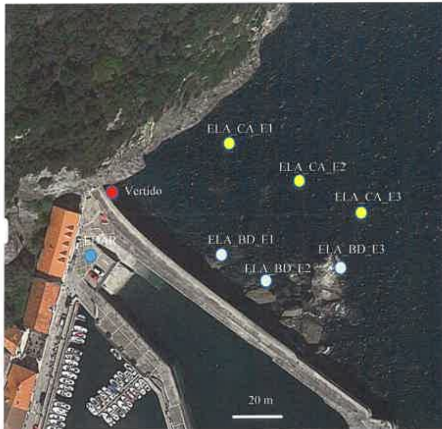
Fig. 4. Plan de Vigilancia de la EDAR de Elantxobe. Detalle de la localización de las estaciones en la zona potencialmente afectada por el vertido (círculo rojo: punto de vertido). Los círculos verdes corresponden a las estaciones del bentos de sustrato duro intermareal. Las estaciones para las variables fisicoquímicas de la columna de agua quedan indicadas con un círculo amarillo.

La red de muestro abarca 3 estaciones: Elantxobe 1 (ELA_BD_E1), Elantxobe 2 (ELA_BD_E2), y Elantxobe 3 (ELA_BD_E3), estudiándose 2 niveles batimétricos (+0,75 m y 1,2 m) de la zona intermareal inferior.